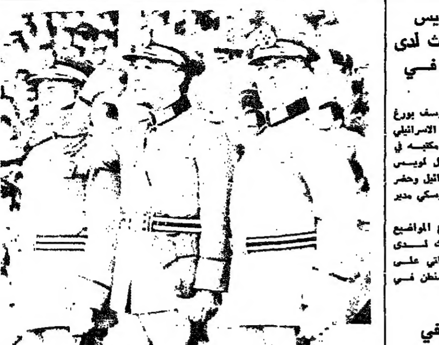
الرئيس محمد أنور السادات يرتدي زي القائد الاعلى للقوات المصرية المسلحة يستقبل العرض العسكري يحيط به نائبه حسني مبارك ووزير الدفاع الفريق اول احمد بدوي.

تركيا تلمح بموافقتها على اعادة انضمام اليونان الى حلف شمال الاطلسي